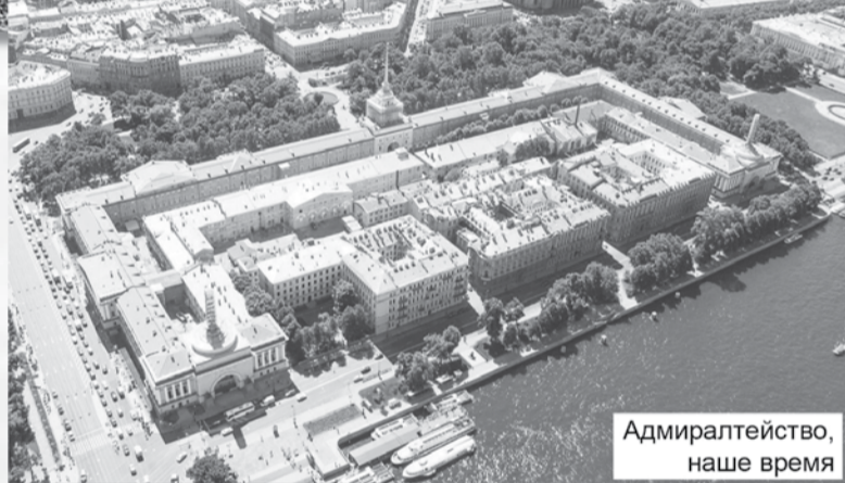
Адмиралтейство, наше время

Она протекала планомерно, по всем правилам осады крепостей. 20 июня под Нарву прибыл