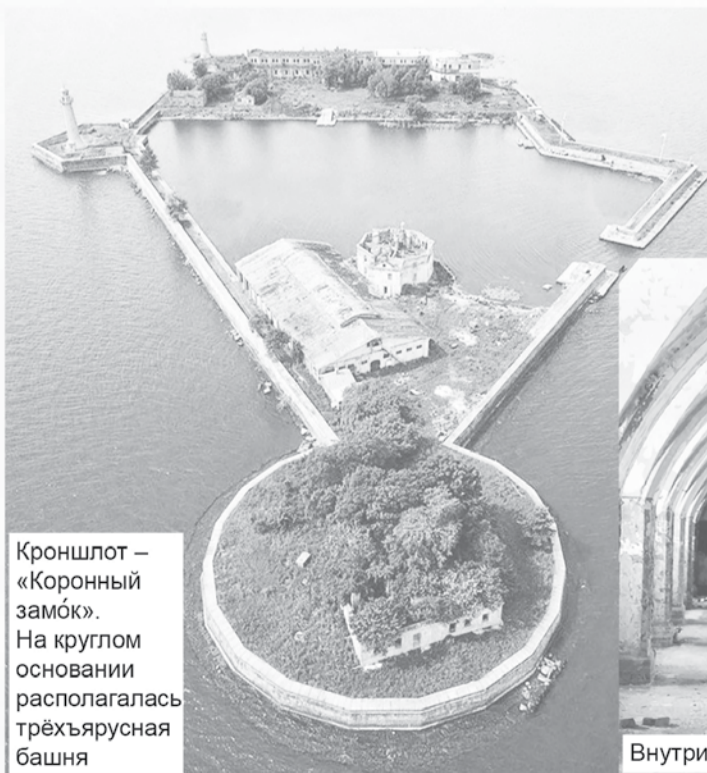
Кроншлот – «Коронный замок». На круглом основании располагалась трёхъярусная башня