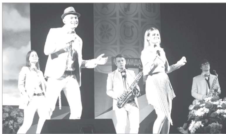
На сцене шоу-оркестр «Street-band»