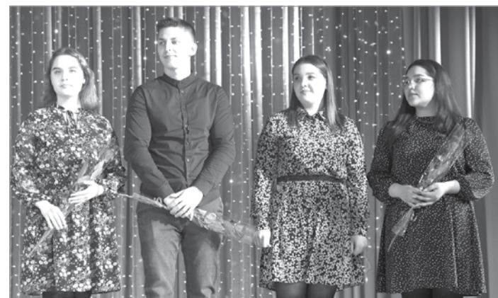
В рядах культработников – пополнение