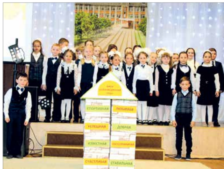
Какая она – наша школа?