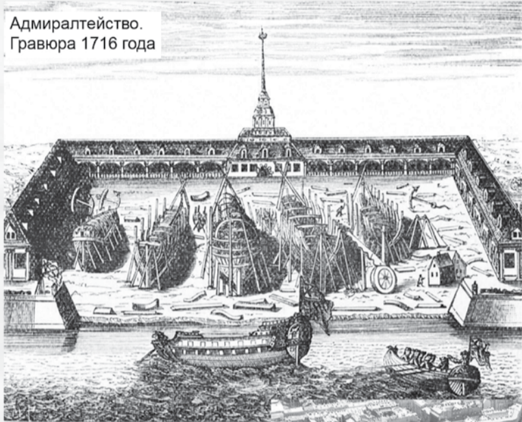
Адмиралтейство. Гравюра 1716 года

привёл свои войска из Дерпта под Нарву, увеличив количество российских войск сразу на 20 тысяч человек.